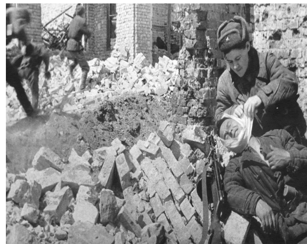
Сталинград в годы войны

Почти неделю сидел в болотах, чтобы не попасть в окружение. Был ранен. Вернулся домой. Благодаря твердости характера, не попал в штрафбат. В Брянске была сформирована дивизия, которая должна была быть направлена в Ленинград. Но попал дед в Сталинград, в страшное пекло войны. Выдержал. В танковой бригаде дошел до Берлина.