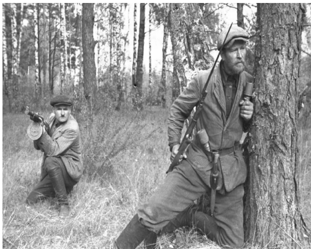
Партизаны в Белоруссии

Он начал войну в 18 танковой бригаде, которая была сформирована под Можайском. Затем попал в окружение, смог уйти к партизанам. Воевал в партизанском отряде в Белоруссии